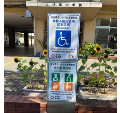
この標示が目印です!

職員玄関前の、青く塗られた1台分が、「埼玉県おもいやり駐車場」です。どうぞご利用ください。