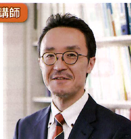
宮崎大学教育学部教授 公認心理師・臨床心理士